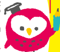
就学援助 イメージキャラクター ツクロウくん

学校教育法などにもとづいて、小中学校の子どもがいる家庭に学用品費や学校給食費などを市町村が援助する制度です。子どもたちの安心して楽しい学校生活のために、気軽に就学援助制度を活用してみませんか。